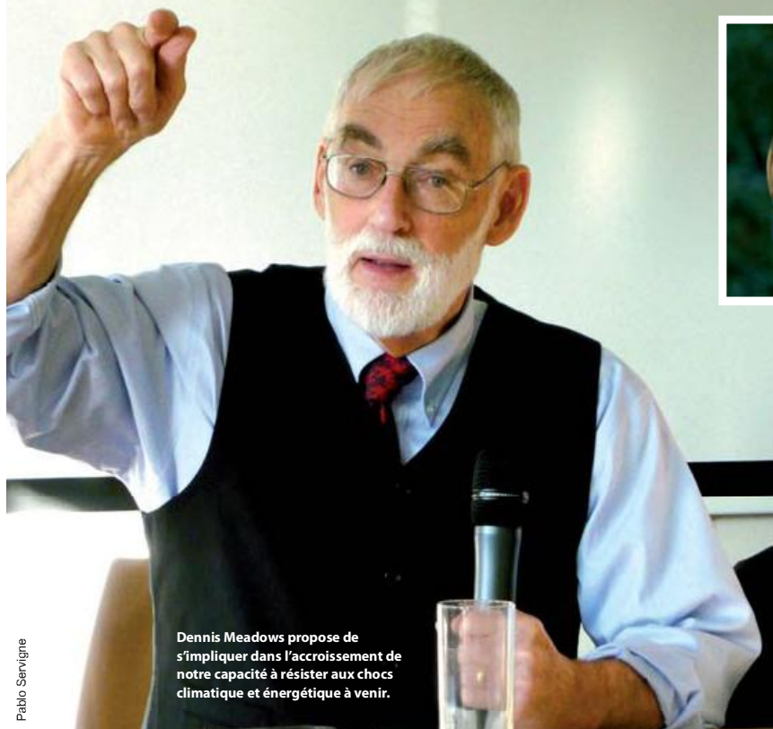
Dennis Meadows propose de s'impliquer dans l'accroissement de notre capacité à résister aux chocs climatique et énergétique à venir.

Dennis Meadows, co-auteur du rapport du Club de Rome