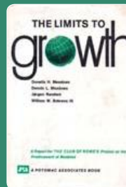
La couverture du premier rapport, c'était il y a 40 ans.

En 2004, la même équipe publie une troisième édition, avec un nouveau logiciel, les données les plus récentes et un texte plus pessimiste. Le livre s'intitule Limits to Growth : The 30-Year Update . C'est celui-ci qui vient d'être traduit en français aux éditions Rue de l'Echiquier (1). Enfin ! ■