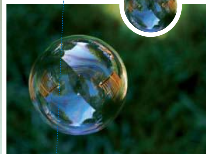
« La forme qui symbolise la fin de la croissance est celle d'une bulle », affirme Dennis Meadows.

Coordinateur du rapport publié en 1972, Dennis Meadows ne cesse de répéter le même message depuis 40 ans : la fin brutale de la croissance « physique » est attendue pour le 21 e siècle. Pour lui, il faut maintenant construire de la résilience pour affronter les chocs à venir.